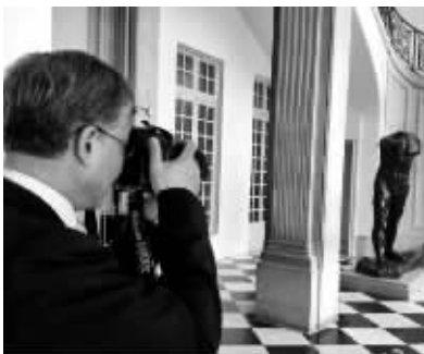
在巴黎罗丹博物馆