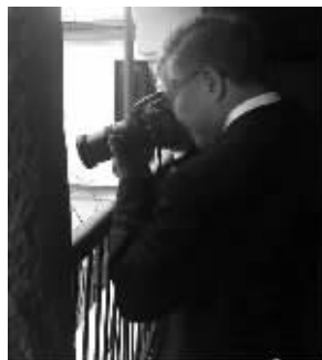
在波哥大圣克拉拉博物馆