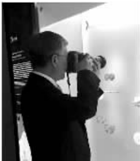
在波哥大黄金博物馆