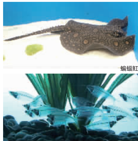
蝙蝠鲶 幽灵鱼

电鳗被称为“水中高压线”,尽管行动迟缓,但想靠近它可不容易。电鳗察觉异常后,能产生足以将人击昏的电流,输出的电压最高达到800伏,在鱼类中放电能力最强。在展柜旁特地设置了瞬时发电装置,让游客通过灯光亮灭,感受电流的强弱。