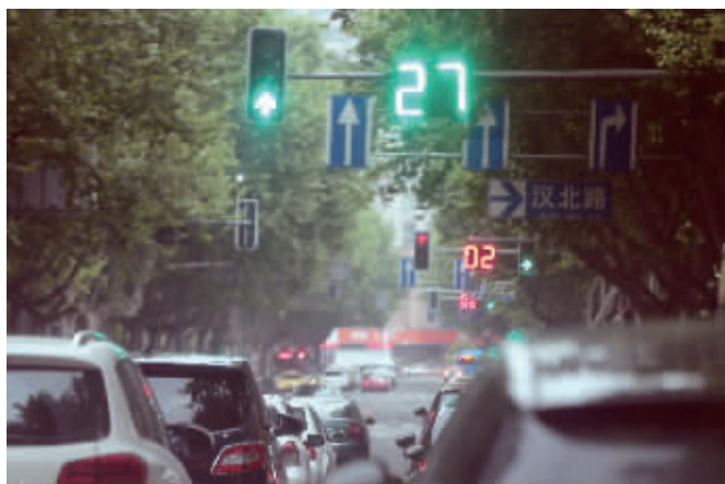
汉中门大街的信号灯