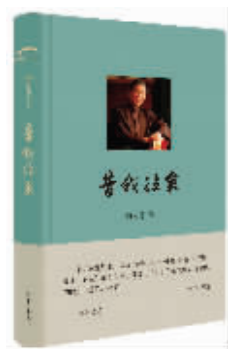
《昔我往矣》 白先勇 著 中华书局 2016年1月

白先勇的文字首先是与他个人的身世与经历分不开的,他是名将之后,出生于乱世,童年时期即遭逢家国巨变。对于平生遭逢的种种变故,以及时代背景下的历史兴衰与人世沧桑,白先生已然能够从容面对、处之泰然;对于世俗人生的世态炎凉与人情冷暖,白先生不是冷眼旁观,而是真诚地投身其中。白先生以自己的眼睛观察,以自己的心灵感悟——当那些沉淀已久的个人记忆逐渐酝酿发酵,那些存在记忆档案里的旧照片拼拼凑凑,也开始排列出一幅幅悲欢离合的人生百相来,它们最终转化成一种亲切而又深情的文字,从白先生的笔下缓缓流出,让读者时时悲从中来,甚至不自觉地悄然泪下。