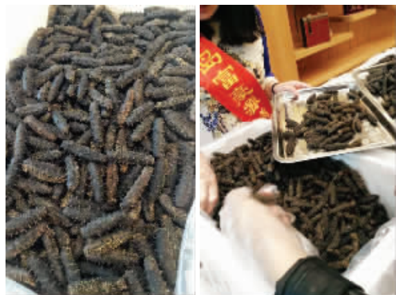
现场售卖的海参 食客们在挑选富豪源海参

活动时间 只剩4月24日、25日两日 (8:30-18:00) 厂家免费咨询电话 4006028827 025-84783633 活动地址 洪武北路55号斯亚置地广场1楼 (德基东,长江路文化艺术中心南) 乘车线路 1、5、9、25、34、27新街口东站下; 2、26、30、46、60路青石街站下即到, 28、33、100、16、35路新街口北站下; 地铁1号线、2号线新街口站德基出口方向