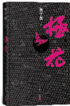
《极花》 贾平凹 著 人民文学出版社 2016年3月

贾平凹这次似乎呈现了一个稍稍有些陈旧的故事。胡蝶,一个好不容易从农村来到城里的中学毕业女生,在她第一次尝试通过努力,为母亲减负时,却被贩至人贫地瘠的圪梁村。在那里,她经历了大多数被拐妇女同样的经历:禁闭、毒打、强奸、生子……故事的结尾有两个:一个是胡蝶被派出所所长救回,但却无法回到原来的生活中去;另一个则是胡蝶在日复一日的被解救苦盼中,逐渐“成了又一个麻子婶,成了又一个薷米姐”。