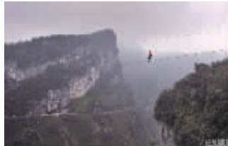
▲在重庆武隆举办的“钢丝侠”大赛比赛现场