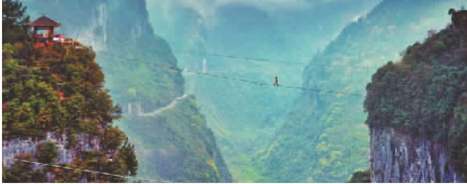
在重庆武隆举办的“钢丝侠”大赛比赛现场

《满城尽带黄金甲》的外景拍摄基地在——武隆!《变形金刚4》里极具转折性的一幕拍摄基地在——武隆!《爸爸去哪儿》第二季开拍的第一站在——武隆!而3月底刚落幕的“钢丝侠”比赛地点,也是在武隆!现在,特价1999元,就可以像“钢丝侠”一样,到重庆武隆感受深度约300米的天坑,还可以穿越赤水河。