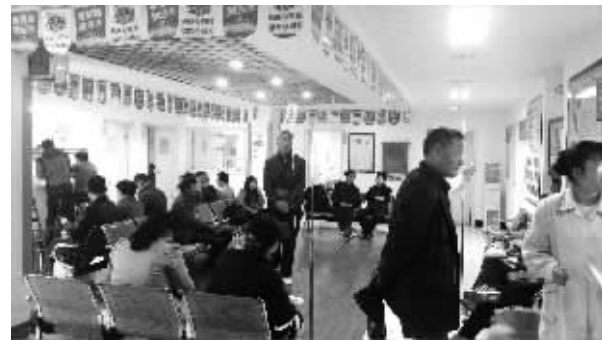
开展无痛查胃后,每天都有市民排队做无痛胃镜

相比传统的胃镜,超精细无痛面条式胃镜更容易被人们所接受,不仅在于它能够有效地检查胃部的炎症、溃疡、息肉、幽门螺杆菌感染以及早期胃癌,更在于它舒适无痛苦的优点,在短短几分钟的检查时间里,像吃面条一样轻松自如地完成检查,这种无痛胃镜让胃病患者很容易接受,因此大大促进了胃病的初诊和复诊。对于本身由于高血压、心脏病等因素而不能进行无痛胃镜检查的中老年朋友,则可以选用不插管下镜的MDX胃肠影像扫描或OMOM智能胶囊内镜系统。