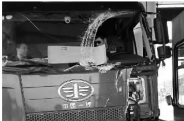
受损的大货车

对此，高速十二大队民警提醒广大车主，故障车上路非常危险，潜在的车辆隐患影响道路交通安全，货车载物较重，一旦发生交通事故后果不堪设想。为了自己和他人的生命安全，车辆上路前一定要检查，确保无隐患上路。