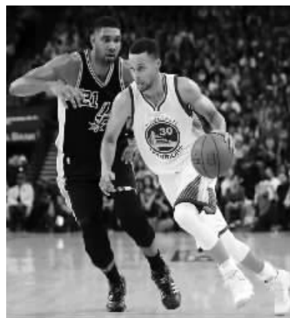
马刺今天能挡住库里吗?