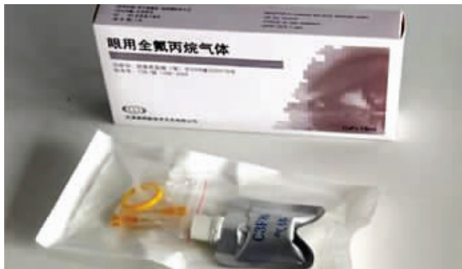
26名患者在南通大学附属医院“打气”用的就是这种气体 资料图片