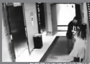
一名男子从电梯走出“搭讪”