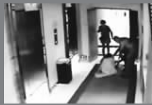
一名路过的女房客赶忙出手相救