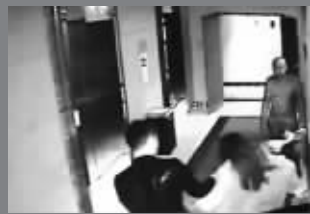
弯弯大声喊叫,引来酒店工作人员