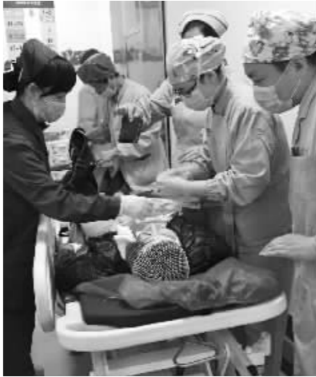
101医院救治伤者