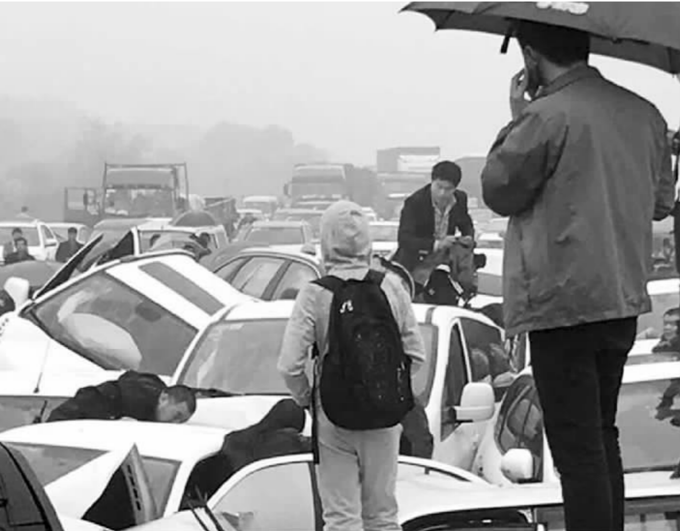
沪蓉高速车祸现场 请图片作者联系我们领取稿费