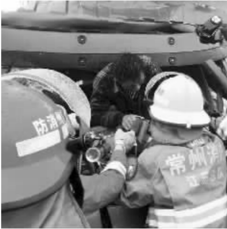
消防队员在施救