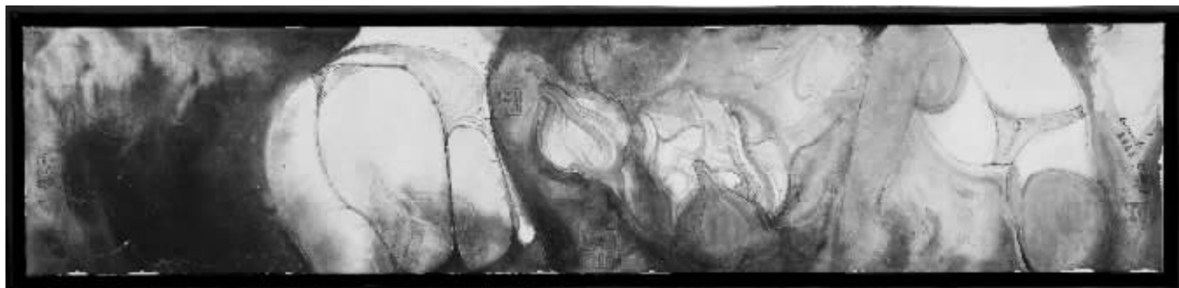
梁雨《梦翎琅之十六》

KEYIART·艺术衍生品，由可一美术馆自主研发，以艺术家的绘画作品为主，开发出丝巾、羊绒围巾、洋伞、移动电源、限量版等近百个品种，以及南京市博物院、林散之纪念馆授权的数百个品种经典书画作品的限量版。