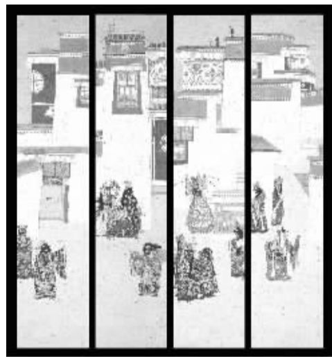
《高原精灵-伽蓝下的舞者》

艺术总有解不完的“题”赋予艺术家,艺术家也乐于在解“题”中成就自身,从这个意义上讲,也许“结构的状态”将是伴随我一生的课题。