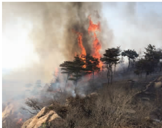
火灾现场

一位目击者介绍，大火大约在昨天下午2点多钟发生，在位于连云街道陶庵社区南侧的山上首先冒起了黑烟，很快，烟雾越来越大，火光冲天而出，“当时风很大，黑烟将整个天都盖住了。”目击者告诉记者。