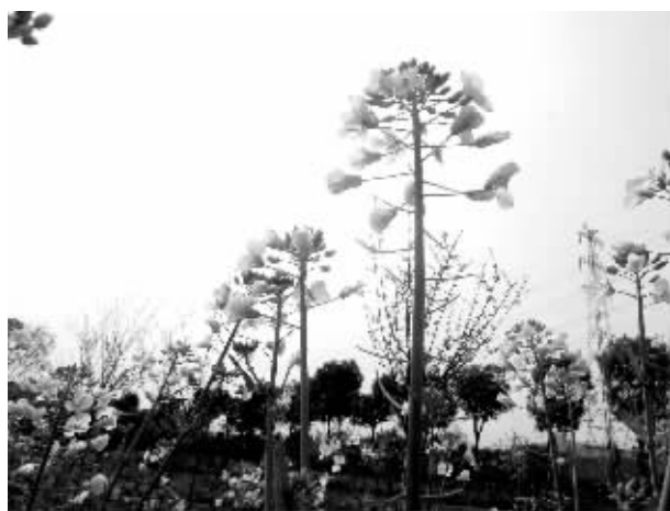
油菜花开得正好