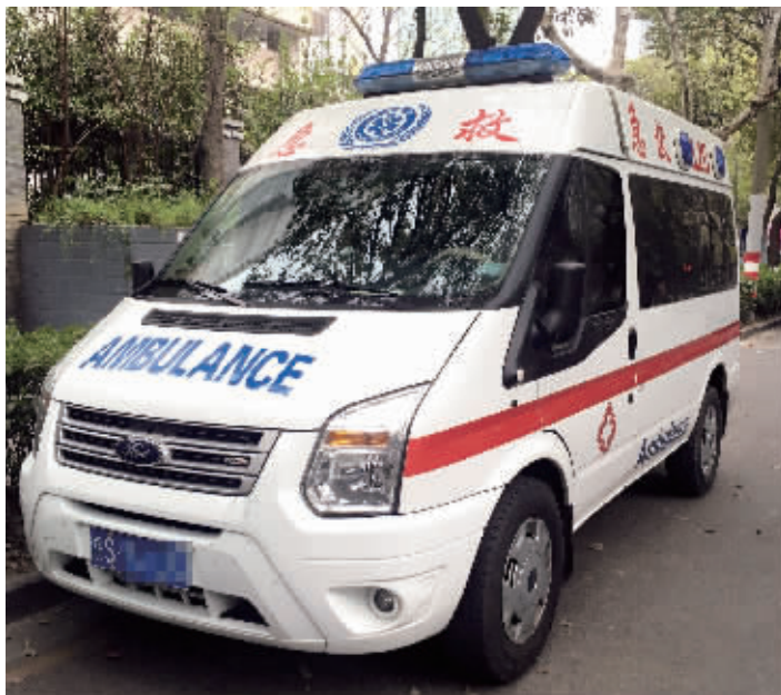
这辆安徽牌照的“救护车”,一直停在南京市区揽业务