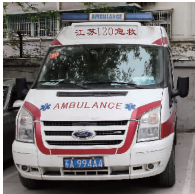
南京市急救中心的正规救护车,车头有“江苏急救”“120”字样