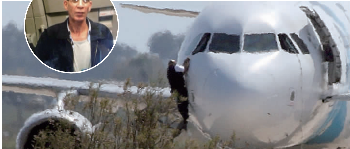
3月29日,在塞浦路斯东南部的拉纳卡机场,一名身份不明的男子从客机驾驶舱窗户爬出