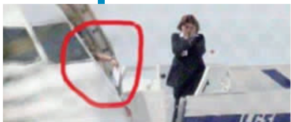
劫机者递出给前妻的信,一名机场女官员双手捂脸站在旁边

塞浦路斯外交部官员称,劫机男子被捕,劫机事件结束,全部人质获释。塞浦路斯方面没有透露更多详情。