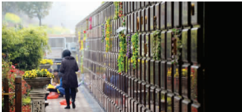
南京超九成生态葬选择雨花功德园