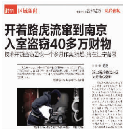
3月22日现代快报新闻报道

防范技术开锁盗窃有三招:第一.及时反锁门;第二.安装门窗报警器;第三.更换安全级别高的锁芯