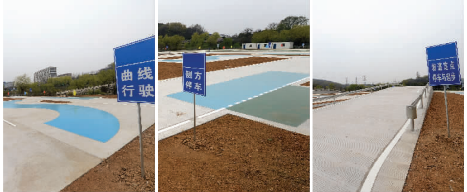
狮麟驾校为自学直考准备的场地昨天开始启用