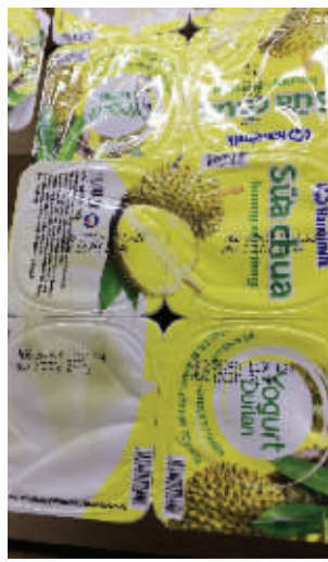
无中文标签的酸奶

根据《中华人民共和国食品安全法》第九十七条的规定:进口的预包装食品、食品添加剂应当有中文标签;依法应当有说明书的,还应当有中文说明书。标签、说明书应当符合本法以及我国其他有关法律、行政法规的规定和食品安全国家标准的要求,并载明食品的原产地以及境内代理商的名称、地址、联系方式。预包装食品没有中文标签、中文说明书或者标签、说明书不符合本条规定的,不得进口。对此,雨花台市场监管局提醒市民,购买进口产品时,可向经销商要求查看“进口食品卫生证书”,不要购买无证的进口食品。