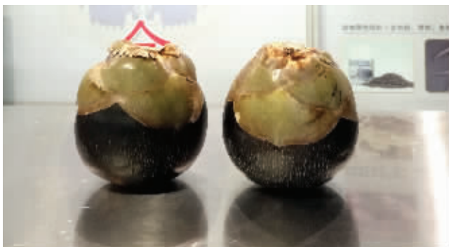
南京机场检验检疫局截获的“炸弹果”

工作人员介绍,这两枚“炸弹果”是一名旅客在印度购买的。检验检疫人员在机场X光机上发现,有两个圆形的物品,随后在检查中发现,这是“炸弹果”。这也是该局首次截获此类物品。