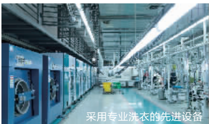
采用专业洗衣的先进设备