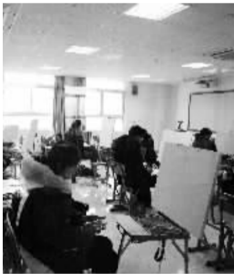
2016年1月20日,江苏省书画院招聘创作人员现场创作