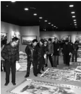
2016年1月21日,评委在江苏省书画院招聘考试作品评选现场

记者:江苏省国画院在全国都具有着极高的影响力,那么,成立江苏省书画院是出于怎样的考虑呢?