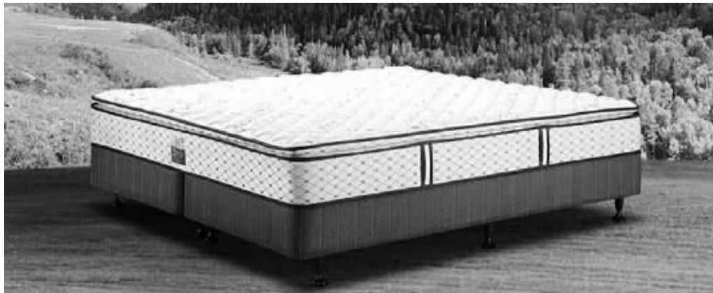
绿色健康环保,是不少床垫产品的宣传重点 资料图片