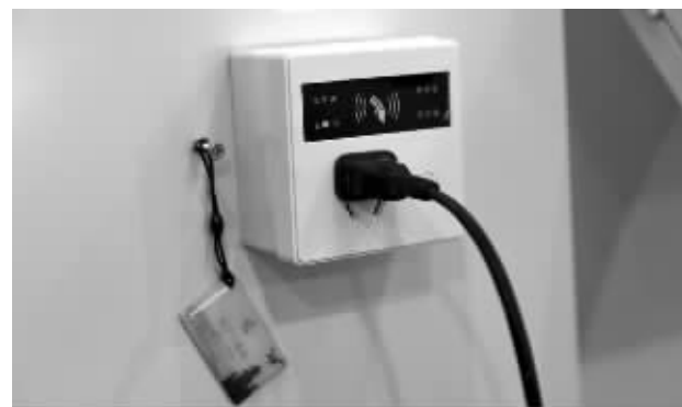
刷卡控制插座