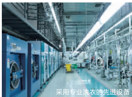
采用专业洗衣的先进设备