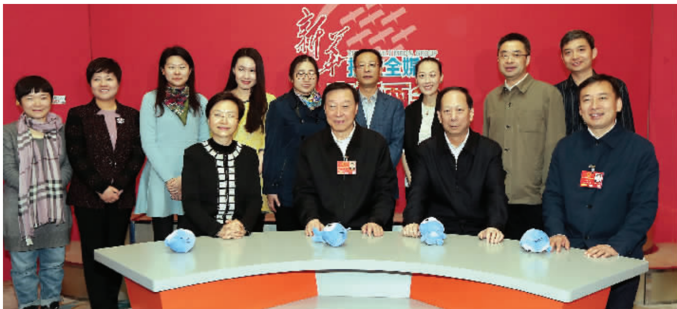
省领导与江苏凤凰出版传媒集团现代快报全国两会报道团队合影