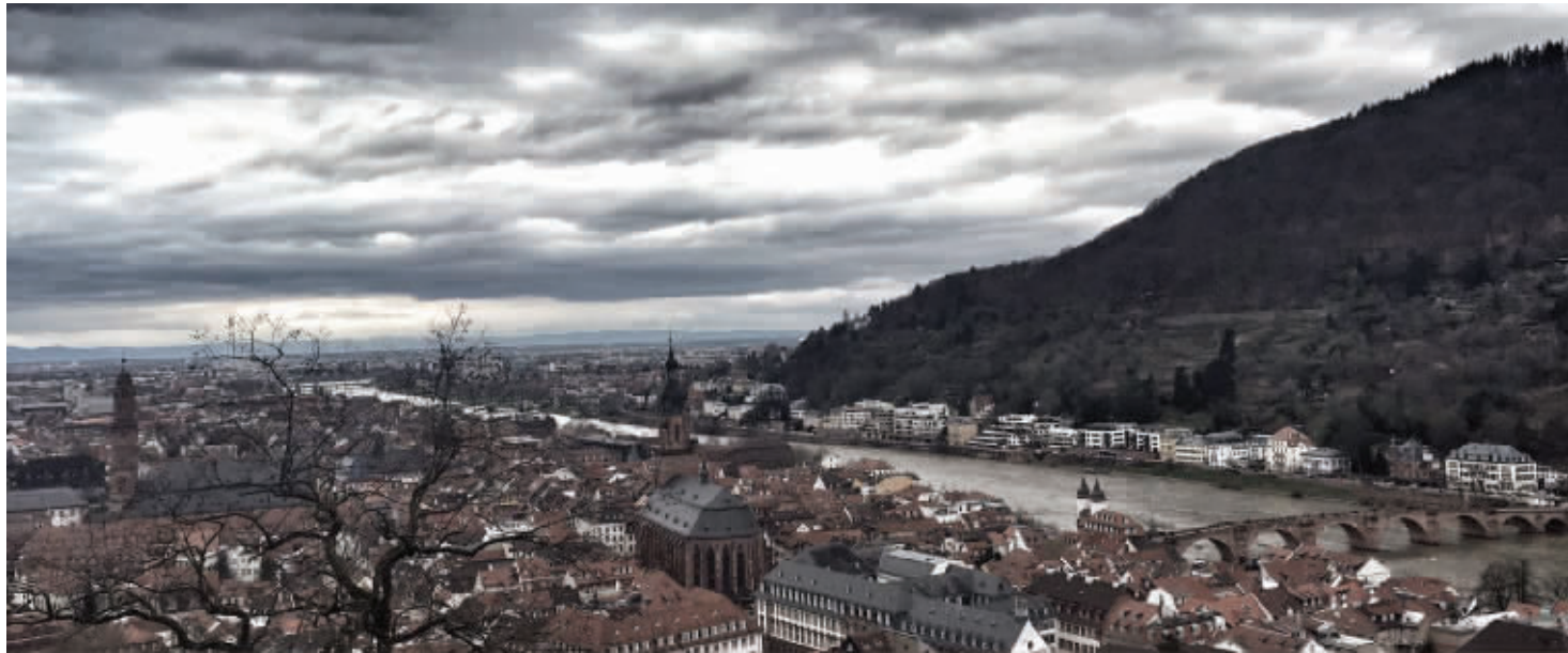
海德堡一景