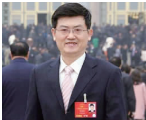
全国人大代表 沈进进

值得一提的是,江苏成年人与学生体质存在的问题,在全国都有体现。人们经济条件改善了,营养知识却非常缺乏,有的甚至进入了误区。沈进进代表说,“所谓的营养大师泛滥,走了一个林光常,又来了一个张悟本,使得公众的营养意识混乱。”这样的结果是,不仅没有得到营养健康,还造成一些病人耽误了治疗。