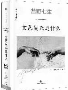
2016年1月 中信出版社 [日]盐野七生著 《文艺复兴是什么》

艺术是人类最敏感的神经。如果没有圣方济各的努力,文艺复兴“土壤”至少不可能如此“肥沃”;如果没有腓特烈二世对教会权力的极力抗争,文艺复兴的高度很可能打“折扣”。有趣的是,无论圣方济各还是腓特烈二世,他们的改造与抗争,并非源自文艺角度。