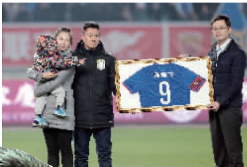
俱乐部赠送“9号球衣”的牌匾