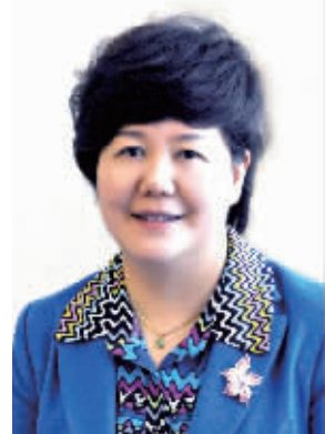
全国人大代表王咏红

长期和医护人员打交道,王咏红说,自己很能体会他们的辛苦。她表示,“最美姿势”只是医护人员工作辛苦的一个缩影,很多医生一个门诊下来经常要看了100多个病人,连口水都喝不上。遇到手术更辛苦,一天七八台手术下来,没有时间坐下来好好吃顿饭。她还特别举例说,全国人大代表、江苏