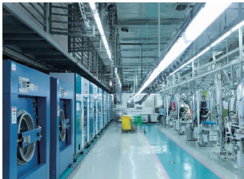
采用专业洗衣的先进设备