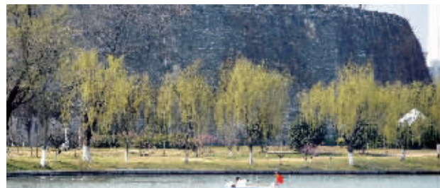
城墙下的柳树悄悄绿了

快报讯(记者 余乐)蜡梅还在开,梅花笑得正艳,昨天现代快报记者发现,秦淮河两岸、台城、玄武湖十里长堤等地,柳树也发芽了。