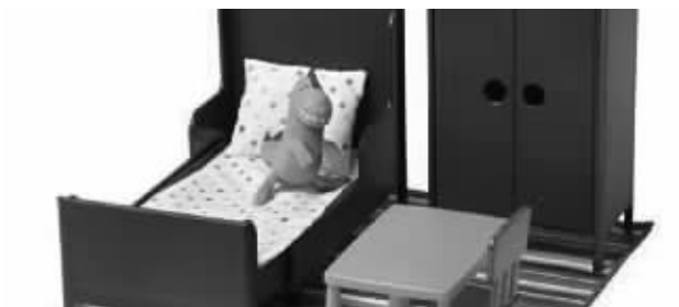
胡赛特玩偶家具可以让孩子发挥想象力,进行装饰和搭配