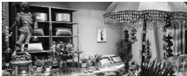
与野兽派合作,印度高端家居零售品牌 Good Earth 开始进入中国市场

“自2016年开始,野兽派已不再只是花店,而是一个全渠道的艺术家居生活品牌,表达花一样的生活。”