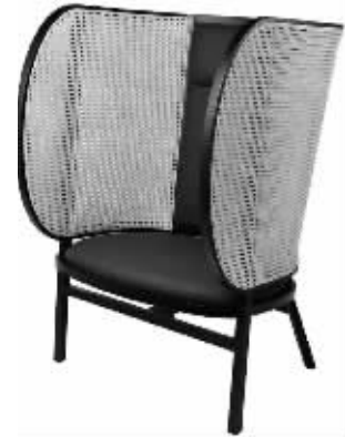
由瑞典公司设计的这款躺椅,融合了传统工艺和现代技术,获得本届iF设计金奖

iF Design Award (iF设计大奖)由德国iF汉诺威国际论坛设计有限公司主办,诞生于1953年,至今已有60多年的悠久历史。它以振兴工业设计为目的,提倡设计创新理念,每年都会召开国际性竞争大赛,被公认为全球设计大赛最重要的奖项之一,在国际工业设计领域更素有“设计奥斯卡”的美誉。