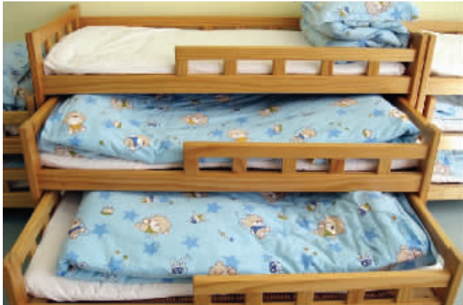
幼儿园的小床能否跟着孩子的身高一起长 资料图片