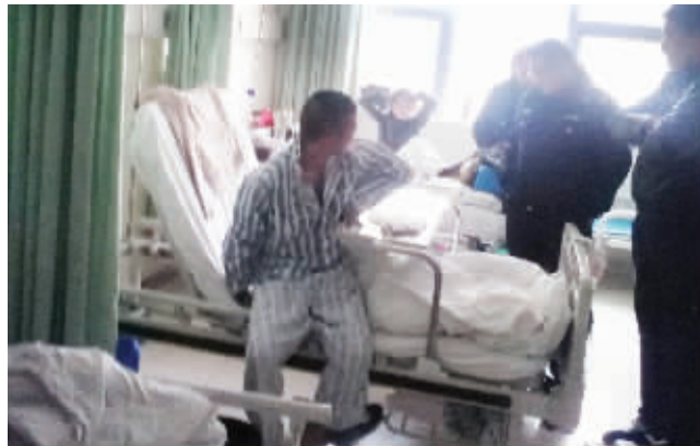
看到警察突然出现在病房,王某惊呆了