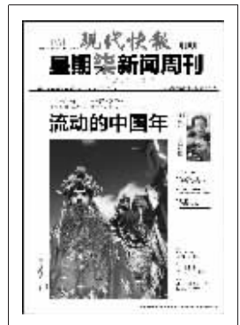
上期星期天新闻周刊封面