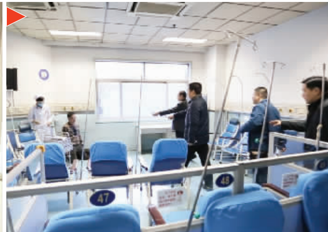
谈判解救人质 戴小刚摄(除署名图片外均为网络图片)