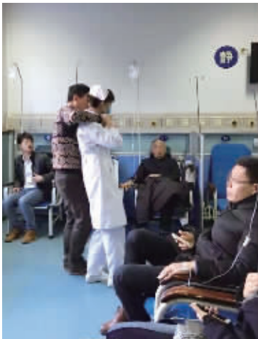
输液室劫持女护士