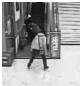
路过男子寻找电梯紧急停止按钮 监控截图