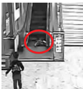
脸朝下摔倒,手指被夹住