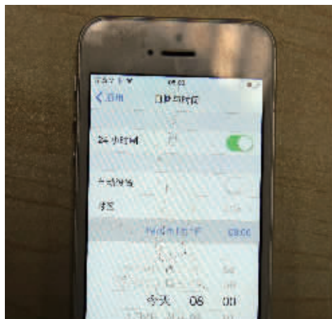
把手机日期设定为1970年1月1日