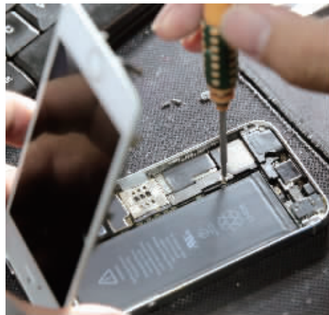
拆开修吧,之后又等待近7小时,它才“活”过来

昨天,现代快报记者来到专业手机维修机构,在手机工程师的帮助下,将两部iPhone的时间设置为1970年1月1日,看到底是否会“变砖”。