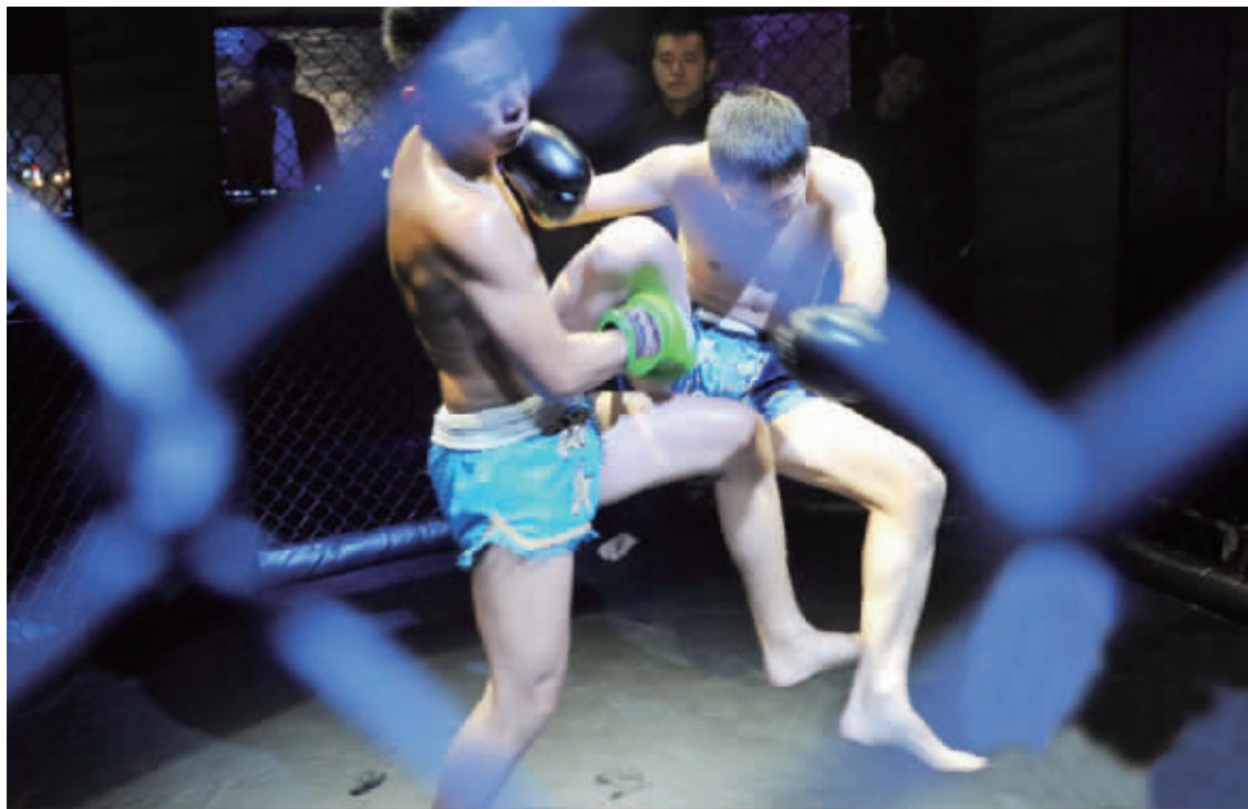
两位选手贴身肉搏

从律师到教师,从白领到司机,从职业拳手到业余爱好者,从16岁的少年到40多岁的壮汉,每个周末的晚上,脱下白天的外衣,变身厮杀的“野兽”。