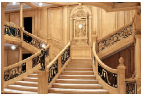
英媒体公布的泰坦尼克2号豪华楼梯

的原型几乎一模一样的构造,比如将会提供同样大小的小型游泳池、土耳其浴室和爱德华七世时代的健身房,也会按照原型的配置设置头等舱、二等舱和三等舱,还有同样规模的餐厅和无线电报室等。此外,这艘船计划于2018年开始处女航,从中国江苏开往迪拜。不过,在报道中并没有公布泰坦尼克2号具体的制造时间与花费。