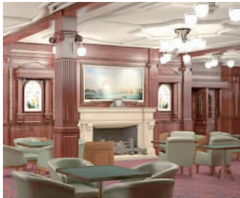
英媒体公布的高等舱里的吸烟室

夫·帕尔默在纽约对外宣布“泰坦尼克2号”游轮复制品的方案以来,每年都有泰坦尼克2号的相关消息流出:原定的处女航时间一拖再拖,从2016年改到了2018年;出发港口也由中国上海改成了中国江苏。甚至在2014年就出现过媒体怀疑泰坦尼克2号计划或将泡汤。