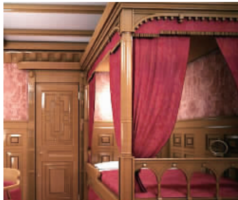
英媒体公布的高等舱里的休息室