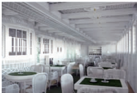
英媒体公布的泰坦尼克2号里的咖啡厅