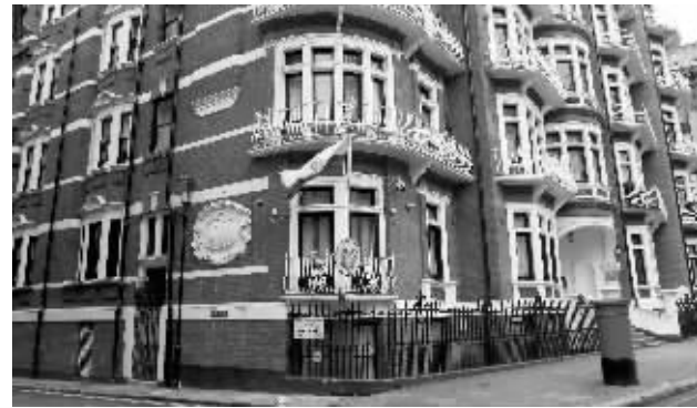
2月6日在伦敦拍摄的厄瓜多尔使馆

联合国一个工作组5日正式认定，“维基揭秘”网站创始人朱利安·阿桑奇自2010年12月起遭到英国和瑞典“任意拘留”，应当被释放并获得补偿。