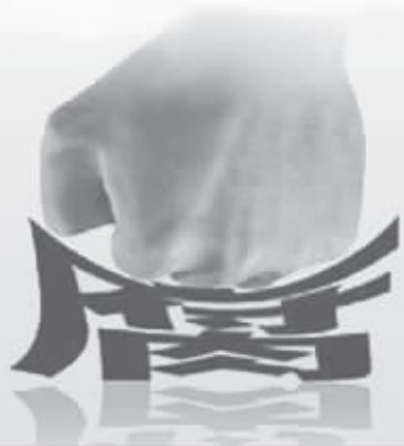
2015年南京正风反腐“成绩单”