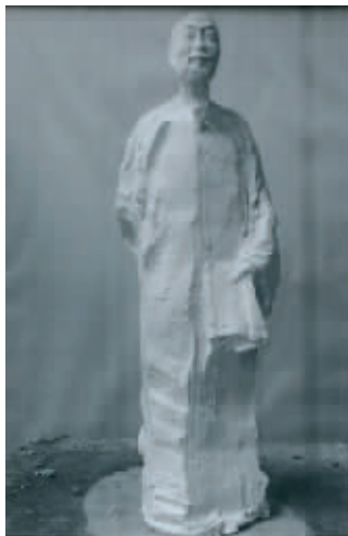
吴为山作品《袁枚》的照片

公众可以发送邮件到wgxwgb@163.com,或在现场的意见本上留言表达看法。