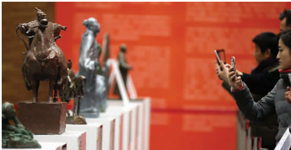
南京文化名人雕塑入围作品在金陵美术馆展出