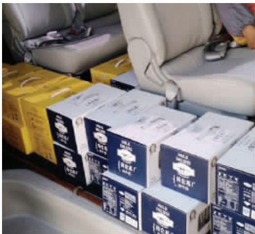
24箱牛奶就是这样码放在面包车里的