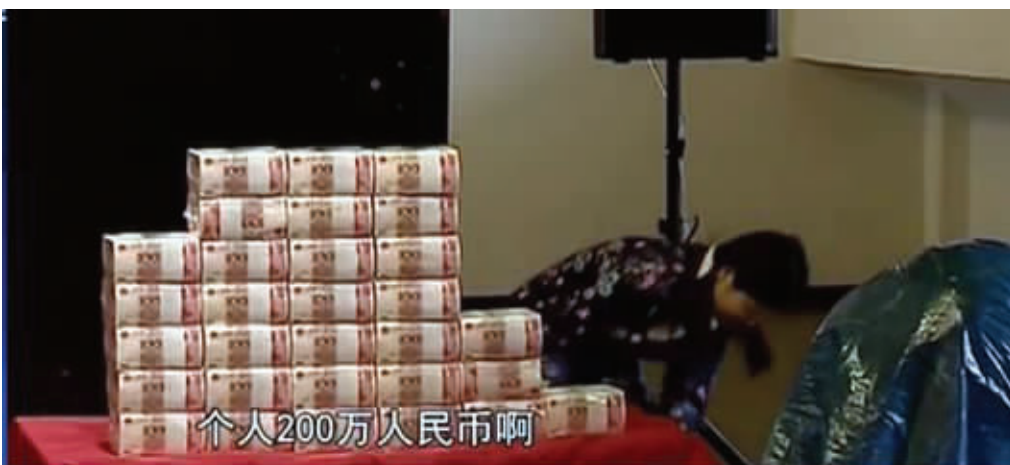
颁奖现场堆起的现金 视频截图