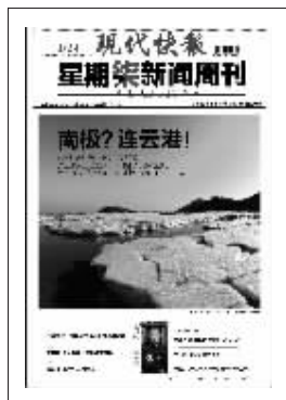
上期星期天新闻周刊封面