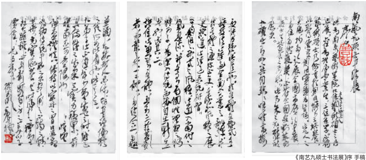
《南艺九硕士书法展》序 手稿