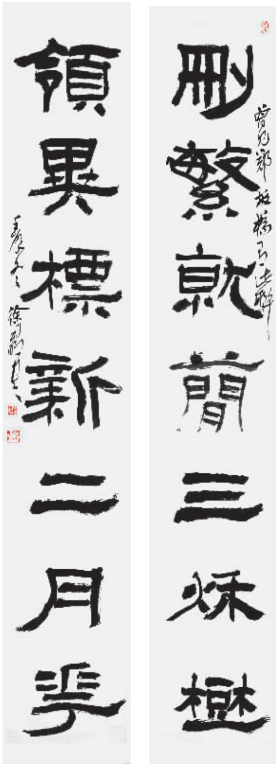
删繁就简三炼榭 领异标新二月秀

主持完成了文化部全国艺术科学基金项目《书法创作理论研究》,专著《中国书法风格史》获2015年国家社会科学基金中华学术外译项目立项。发表学术论文90余篇,曾获全国隶书学术讨论会二等奖、中国文联2001年度文艺评论三等奖、第八届中国文联文艺评论奖文章类二等奖、首届江苏紫金文艺评论奖一等奖。出版专著、译著、编著、教材、辞典计22部。《利明书法教程》(30集)作为教育部卫星电视艺术教育节目,在中国教育台、中央数字《书画》频道及网络视频播出。