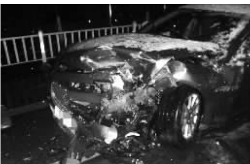
两辆汽车均损毁严重,捷豹(右)修理费估计要40万元

快报讯(通讯员 卞志鹏 记者 林清智)1月21日凌晨1点50分左右,镇江扬中市区发生一起交通事故。双方当事人均酒后驾驶,两车损失达50余万元。现代快报记者了解到,事故一方是一名女子,事发时血液酒精含量达到醉驾标准,事故和她错将刹车当油门有关。而事故另一方不但是酒驾,还带着怀孕的妻子。