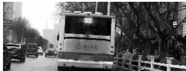
公交车尾部的显示屏上出现“SOS”,让人捏把汗 封波 摄(请联系我们领取稿酬)

现代快报记者随后从公交公司了解到,司机对于显示屏上发出“SOS”信号并不知情,在发现显示屏有故障后就回厂检修,该车下午已正常运营。