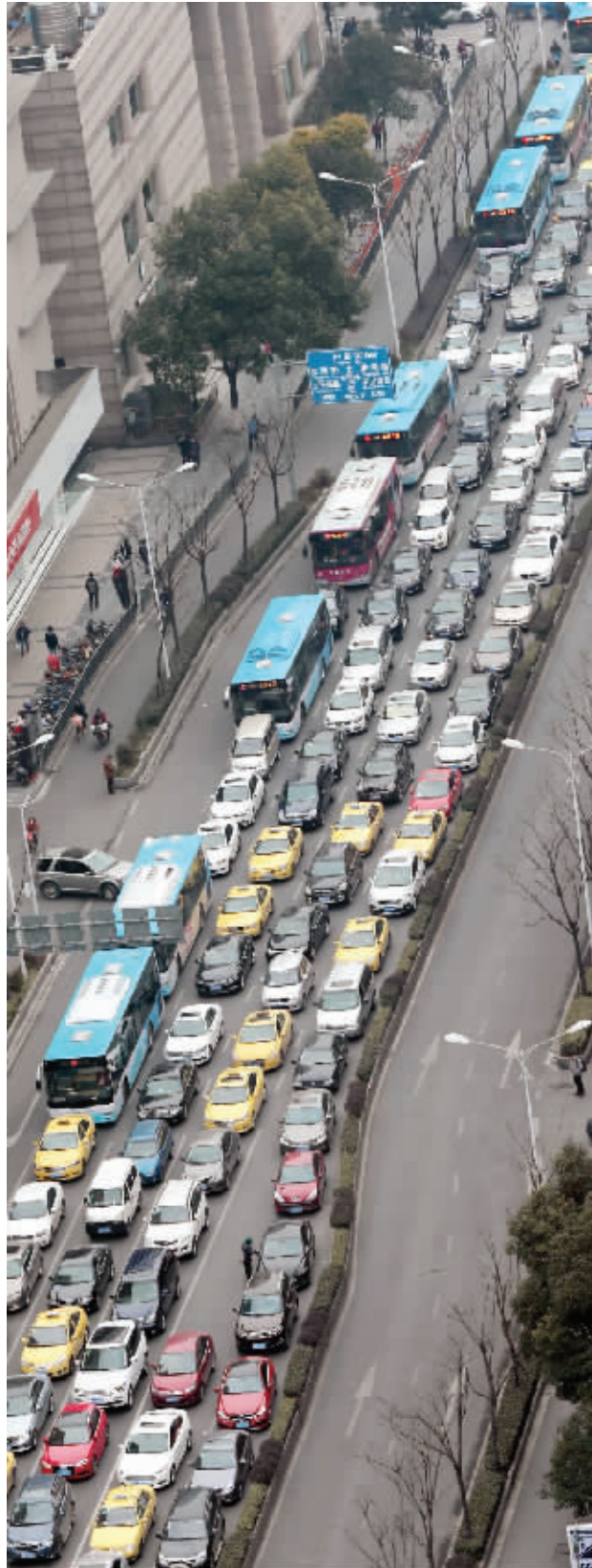
昨天下午,新街口洪武路上的汽车长龙